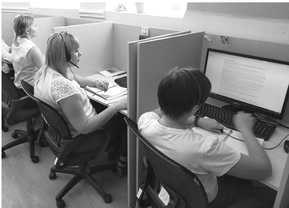
● Операторы колл-центров региональных операторов всегда готовы разъяснить, подсказать и выслушать своих абонентов

Если сумма в платежке выставлена на неправильное количество проживающих, то вы можете обратиться в ближай-